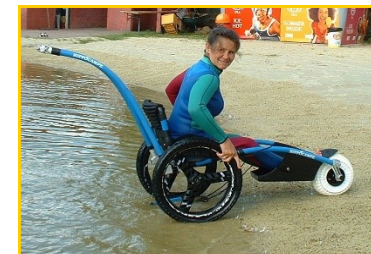
L'hippocampe, fauteuil amphibie