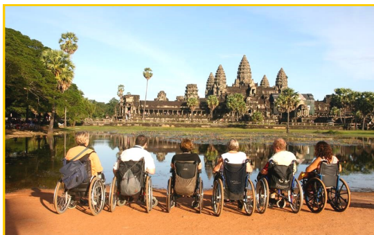
Nos voyageurs ont pu admirer le magnifique site d'Angkor au Cambodge

Concrètement, les personnes moins valides sont accompagnées et d'autres personnes valides participent aussi aux activités comme dans n'importe quel groupe de touristes, d'amateurs de culture ou de sportifs.